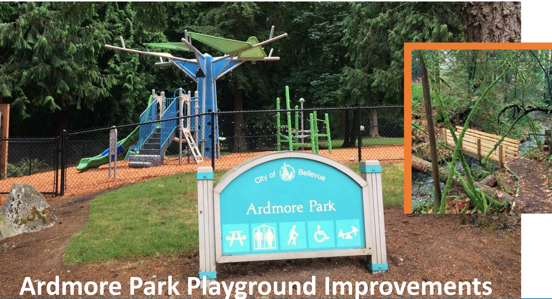
Ardmore Park Playground Improvements