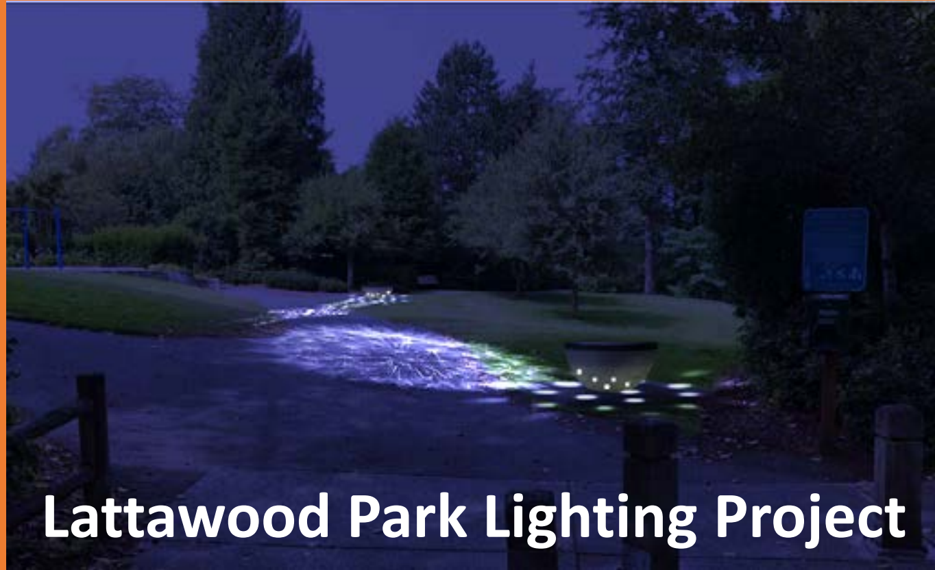
Lattawood Park Lighting Project